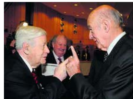
Sie können sich seit Jahren und verstehen sich: Altkanzler Helmut Schmidt (l.) und der frühere französische Präsident Valéry Giscard d'Estaing.

"Die Finanzkrise darf sich nicht zu einer globalen Rezession mit fatalen Folgen entwickeln", sagte Altkanzler Helmut Schmidt (SPD) gestern auf der Jahreskonferenz des German-British Forum in der Bucerius Law School vor mehr als 250 Vertretern aus Politik und Wirtschaft. In seiner Rede, mit der er die Tagung der britischen Handelskammer eröffnete, betonte der frühere Bundeskanzler, dass neben Managern und Bankern auch Politiker für die Krise verantwortlich seien. "Regierungen haben die Anzeichen nicht erkannt und versäumt, früh genug einzugreifen." Umso entscheidender sei eine "gute Zusammenarbeit" bei den Rettungsmaßnahmen. Schmidt forderte eine Umstrukturierung bei der Beaufsichtigung der globalen Finanzinstitute.